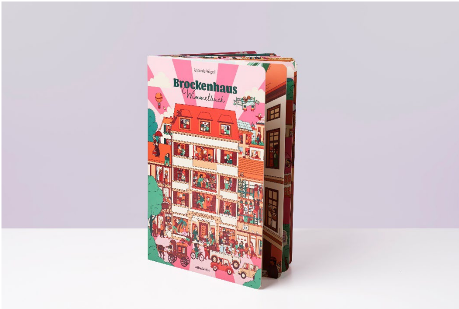
Das Brocki-Wimmelbuch der Bärner Brocki zum 130-jährigen Jubiläum, illustriert von Antonia Vögeli und herausgegeben vom Verlag vatter&vatter.