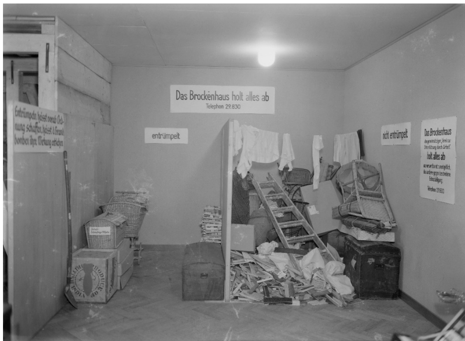
Ausstellung im Gewerbemuseum (heute Kornhausforum) 1937 mit einer Installation zu Ehren der Bärner Brocki und als Werbung für ihre Dienstleistungen.